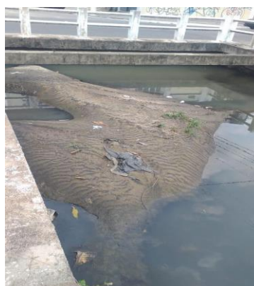
Figura 11: Assoreamento do trecho do CDM com a Av. Eng. Fernando Guilhon.