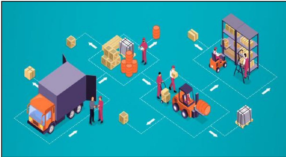
Figura 03: Práticas de controle de estoque.