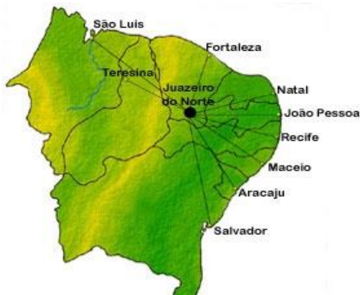
Figura 3 - Ligação Juazeiro do Norte a capitais nordestinas