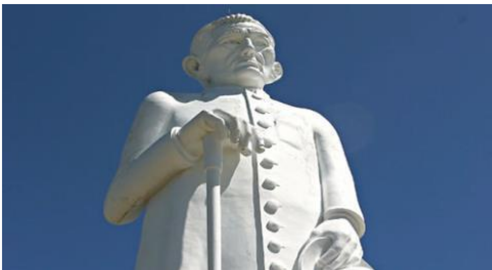
Figura 2 - Estatua do Padre Cicero

Dentre as cidades que fazem parte da região metropolitana do cariri, Juazeiro do Norte se destaca pelo crescimento avassalador que vem passando nos últimos anos em diversos âmbitos desde o setor industrial o qual se destaca sendo o terceiro maior polo calçadista do Brasil, como nos setores de varejo e de serviço especialmente influenciadas pelas romarias do Padre Cicero. O qual em todos os anos traz 2,5 milhões de visitantes, romeiros, para visitar a estátua em seu nome, gerando um aquecimento no comercio local (Juazeiro do Norte, 2019).