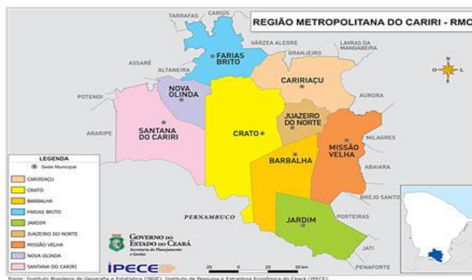
Figura 1 - Área geográfica de atuação da executiva consultoria e projetos.